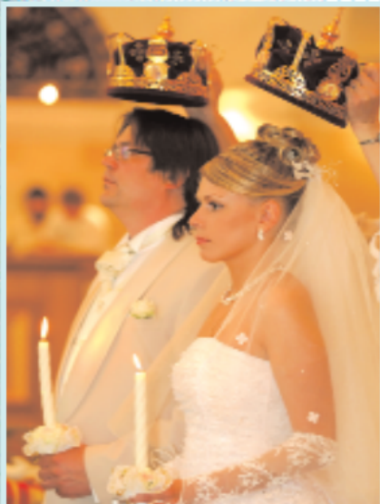
Венчание в храме

воспоминание о нем радуется, но порой любовь включает в себя также и боль. Если другой радуется, и я счастлив. Но если он болеет, и мне плохо.