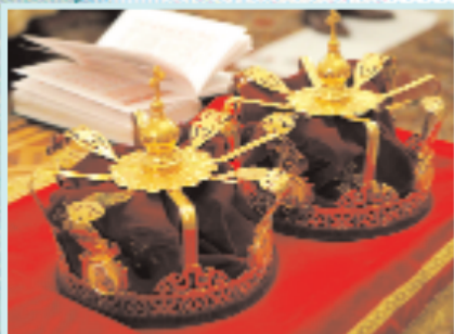
Венцы для венчания