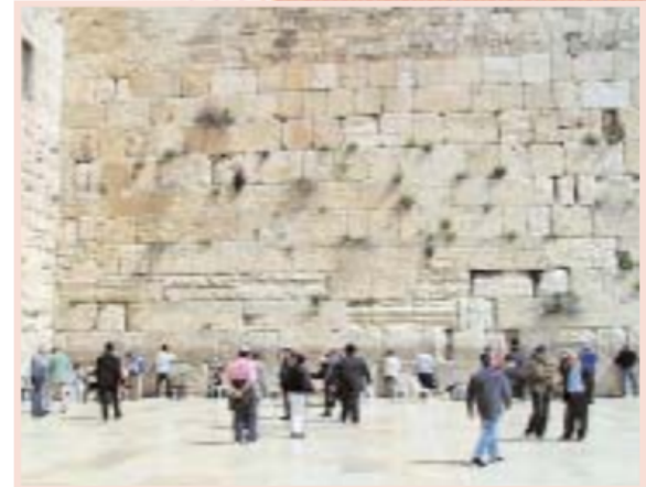
Стена Плача в Иерусалиме

Они могут совершаться в любое время года, раз в год или раз в 12 лет с целью очис-