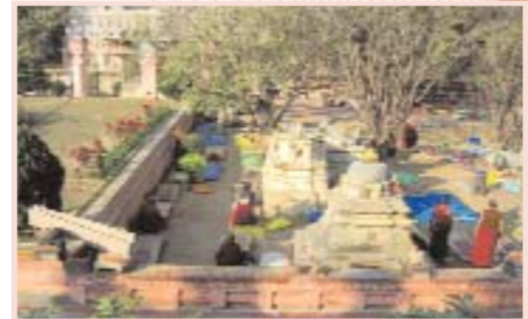
Бодхгая — центр паломничества буддистов, город в Индии. В этом месте Будда достиг просветления